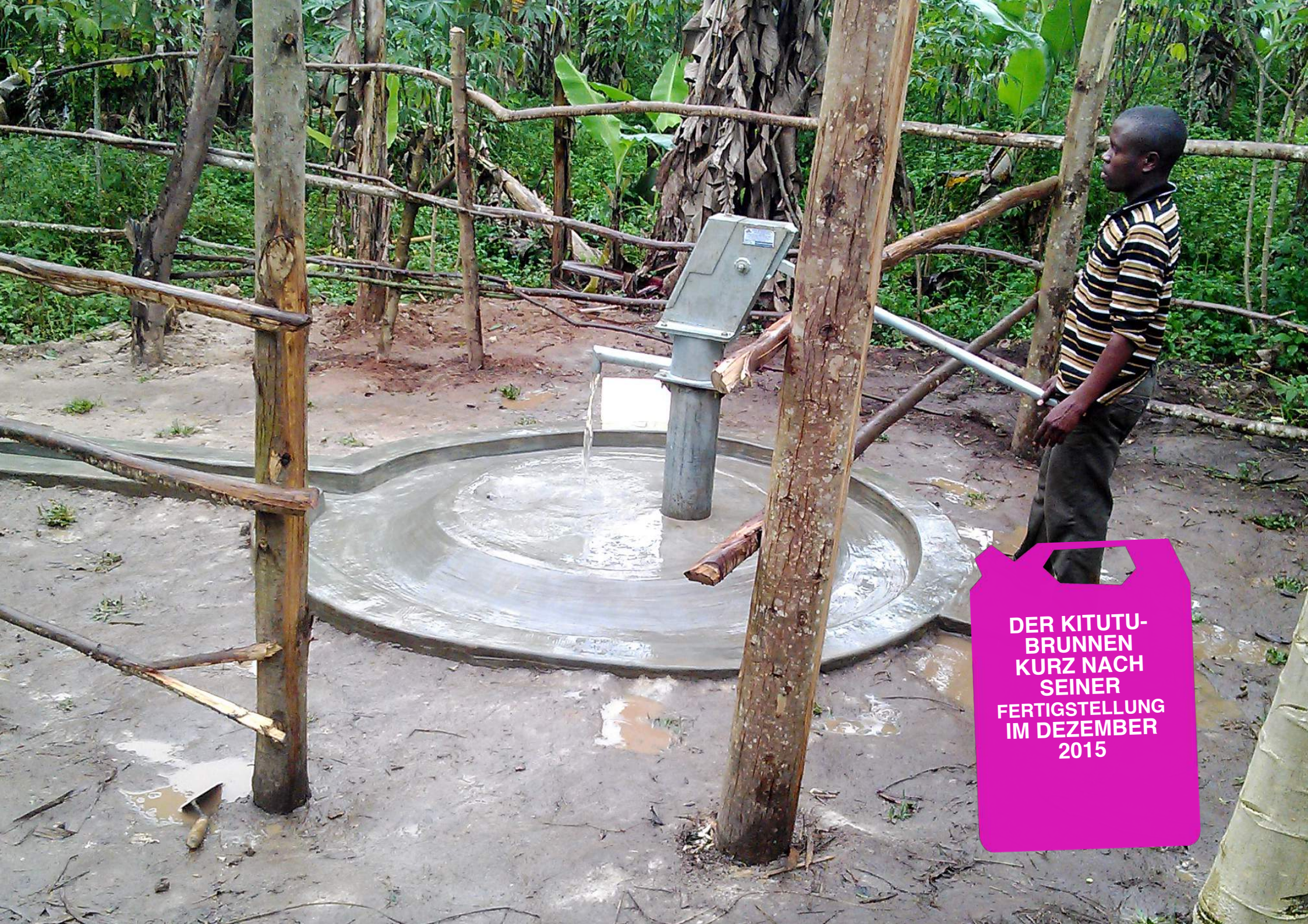
DER KITUTU- BRUNNEN KURZ NACH SEINER FERTIGSTELLUNG IM DEZEMBER 2015